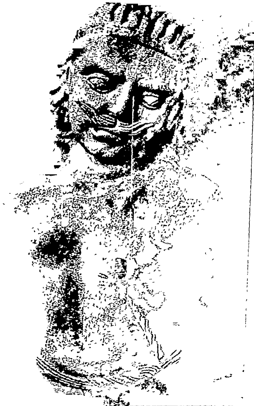
चिट की मूर्ति (पटना के निकट कुम्हार में प्राप्त)